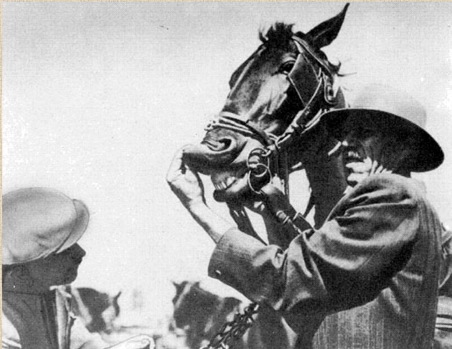
Lóvásár, Hortobágy, hídivásár