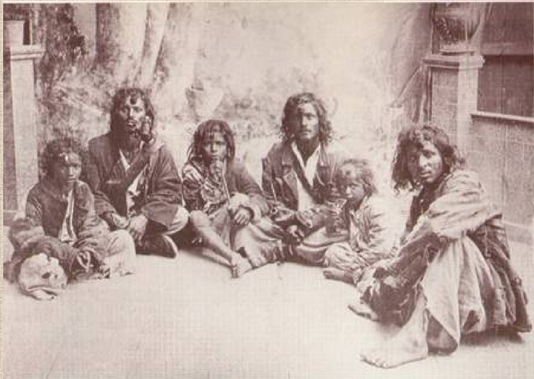
Beás cigányok – Keszthely, 1905