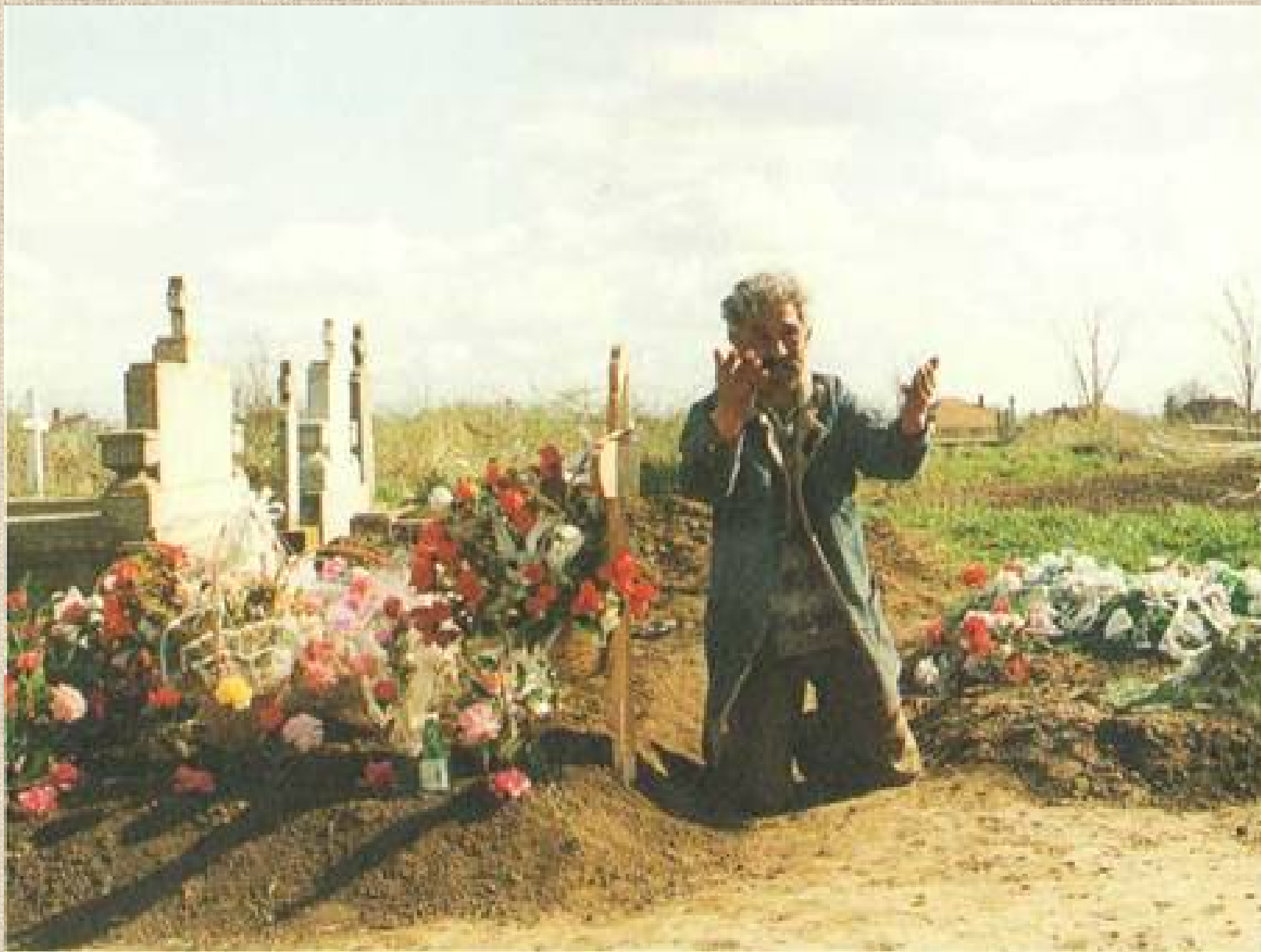
Halott siratása – Kétegyháza, 1995 (Szuhay Péter)