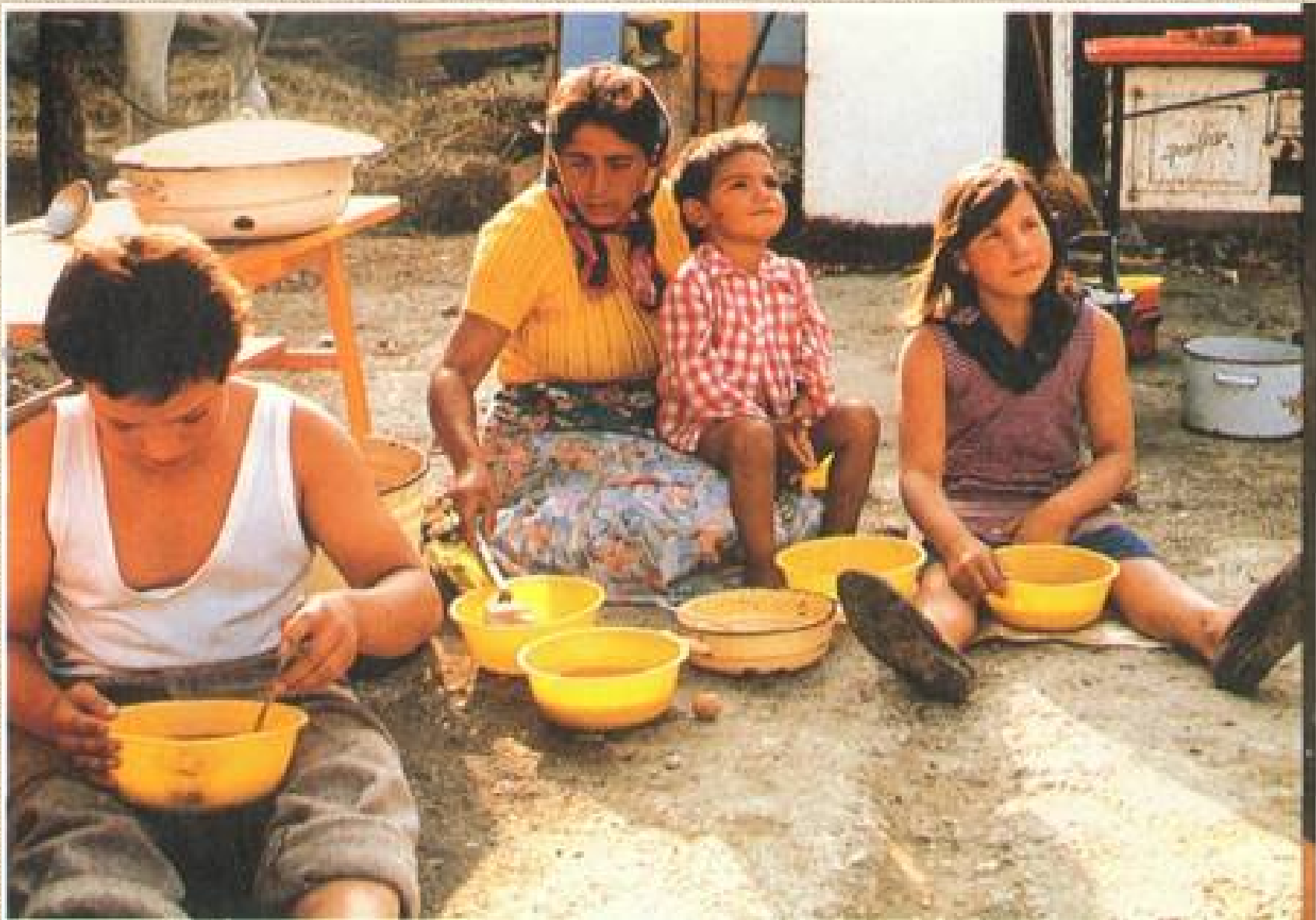
Egytálétel elfogyasztása – Bogács 1992 (Szuhay Péter)