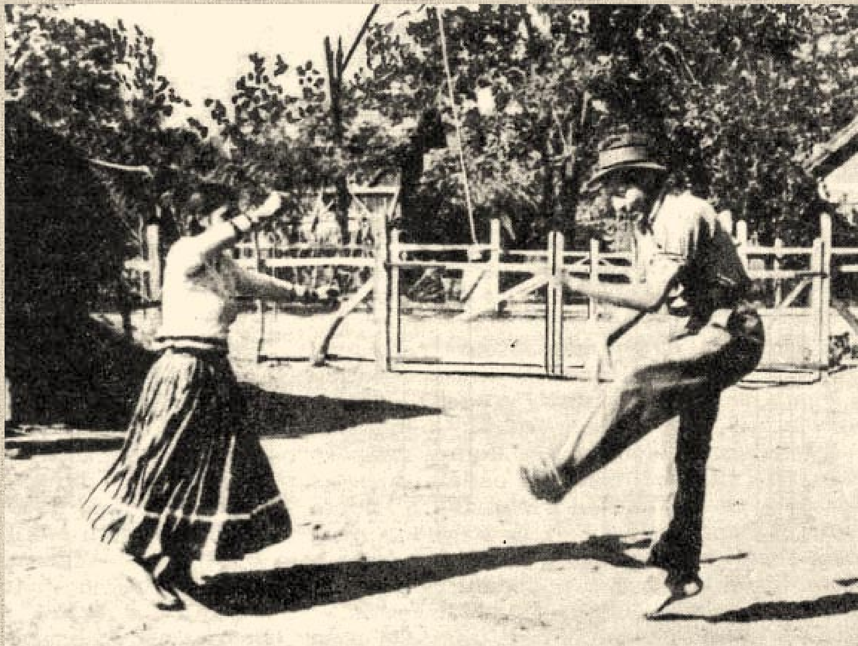
Cigánytánc - Nyírvasvári