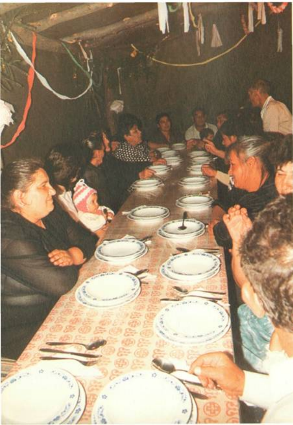
Lakodalom Domaháza, 1992 (Szuhay Péter)