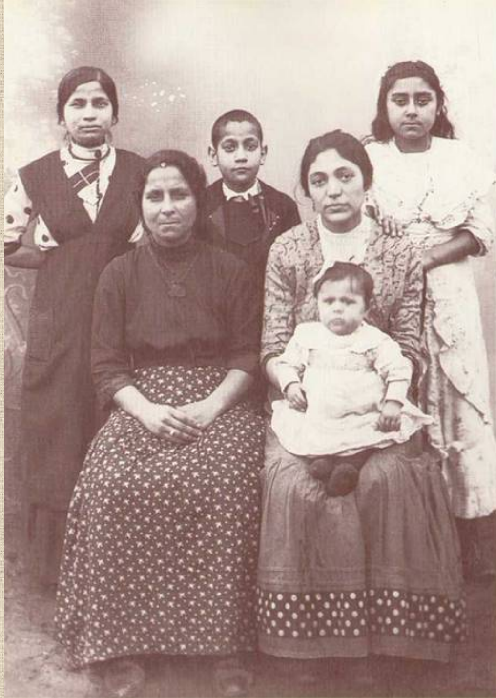
Romungrók Tarnaórs, 1921