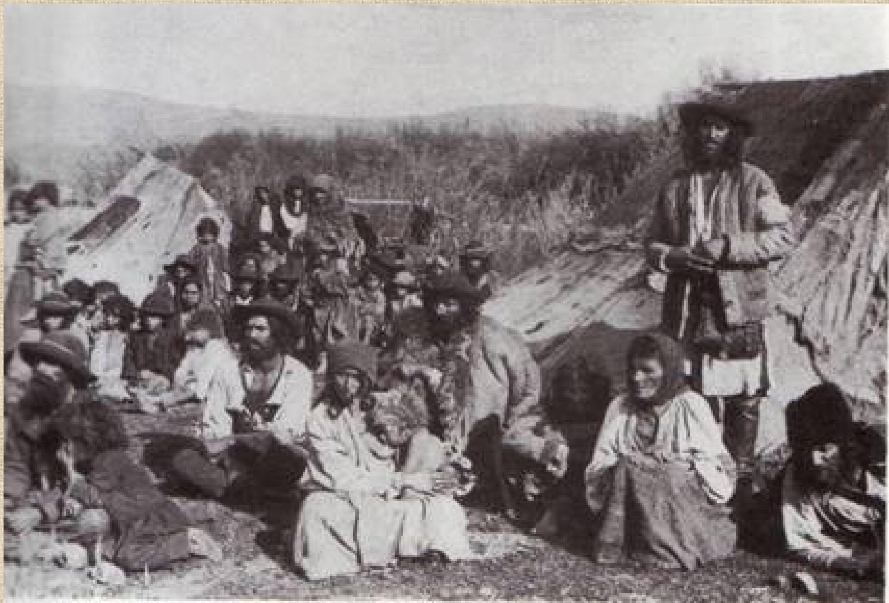
Sátoros oláh cigányok – Brassó megye, 1910