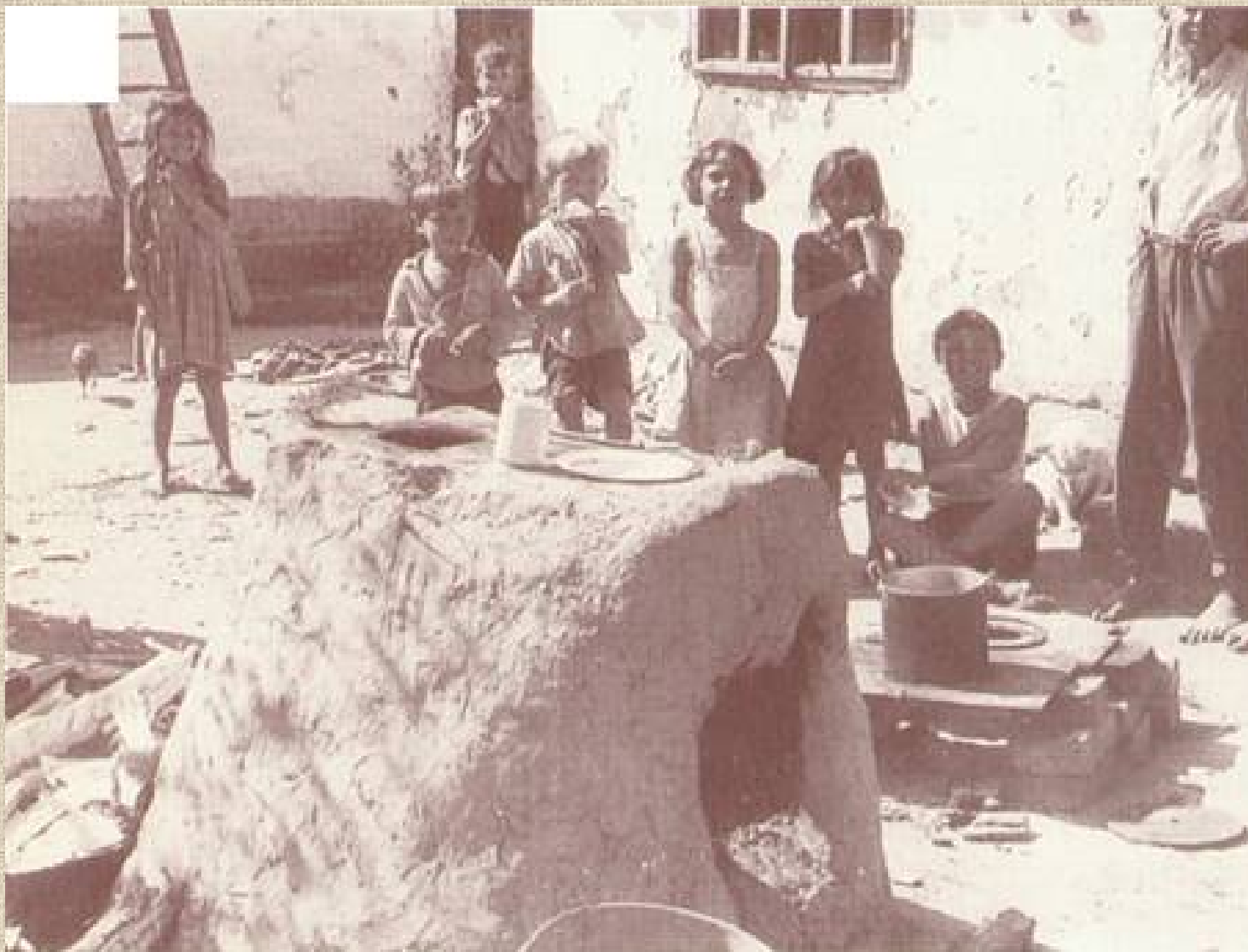
A lakás és a tűzhely határozta meg, mit és hogyan készíthettek el. Őrtilos, 1954 (Eperjessy Ernő)