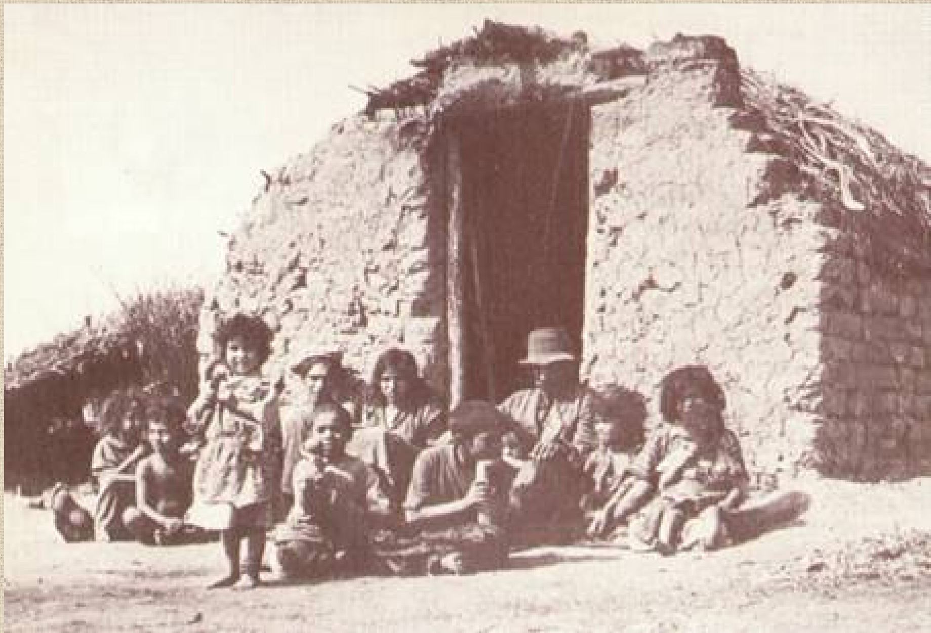
Cigánycsalád - Dályok, 1910