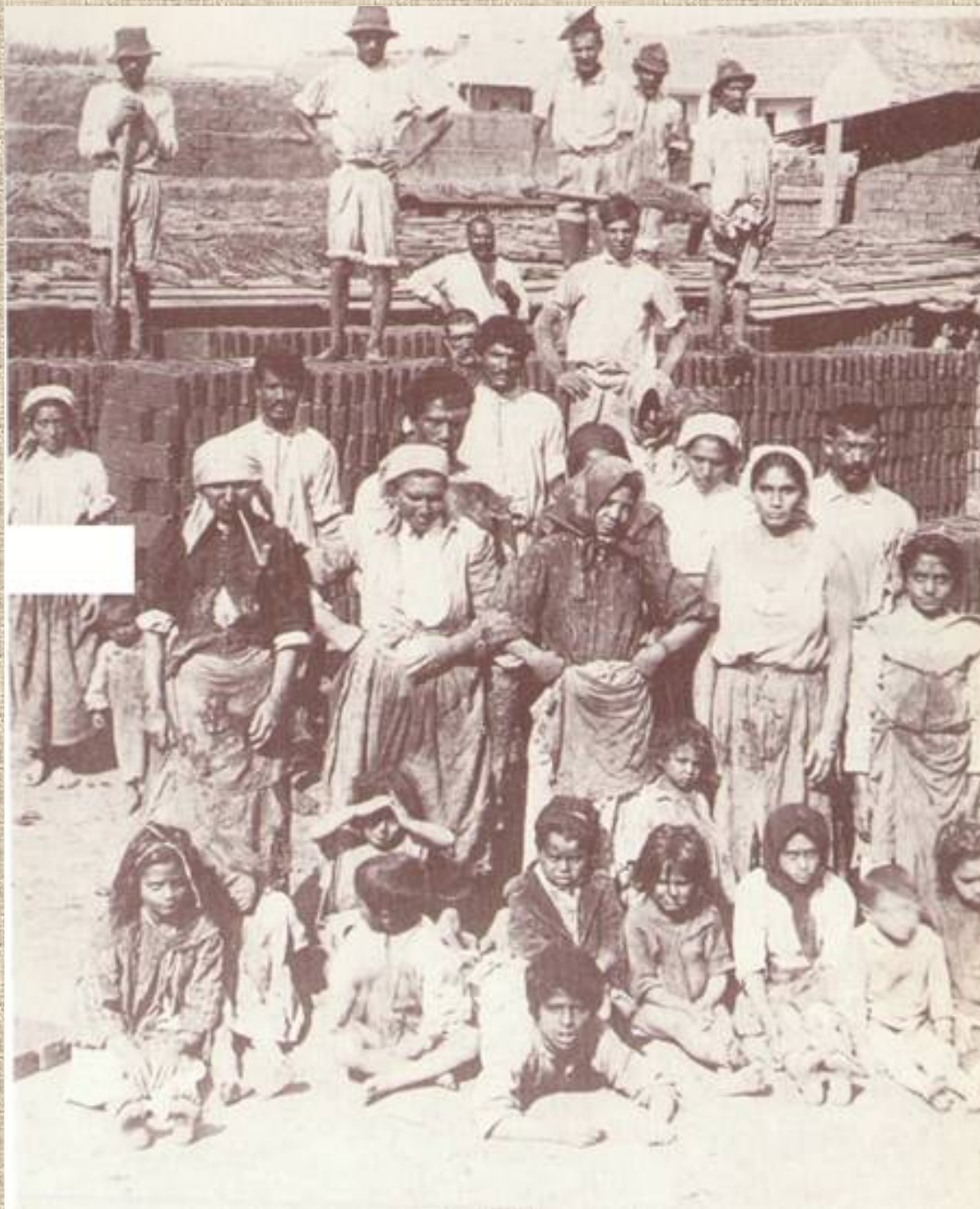
Vályogvetők Csíkszereda, 1911