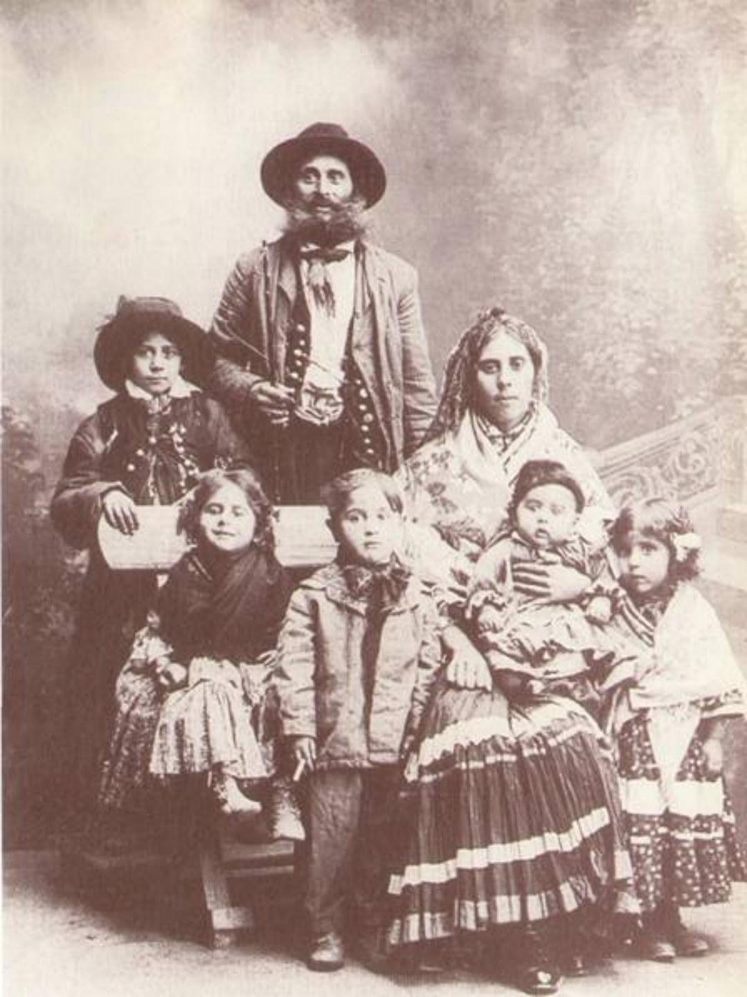
Oláh cigány viselet Zalaegerszeg, 1922