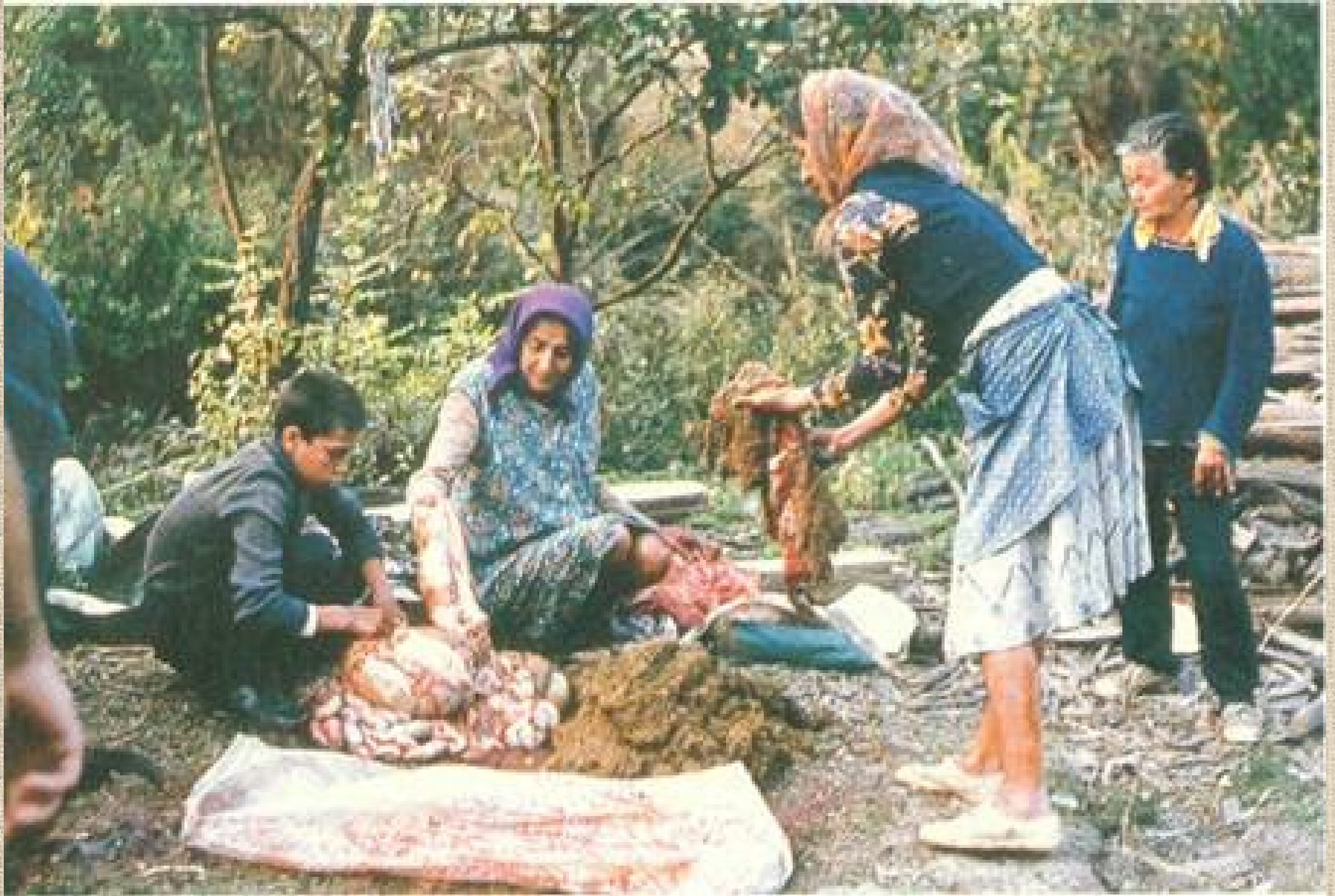
Elhullott jószág feldarabolása – Abod 1980 (Szuhay Péter)