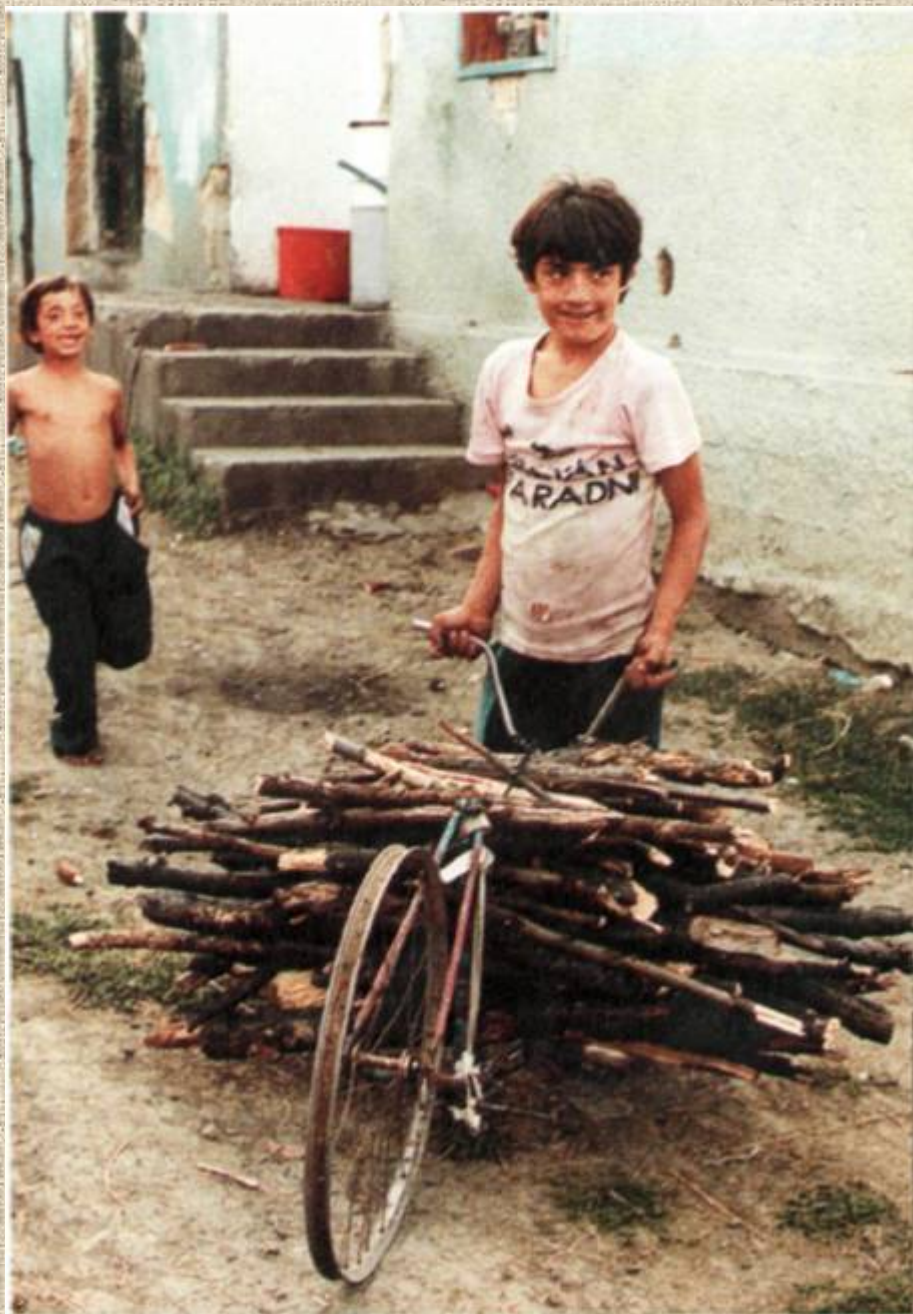
Rőzsegyűjtés 1993 (Szuhay Péter)