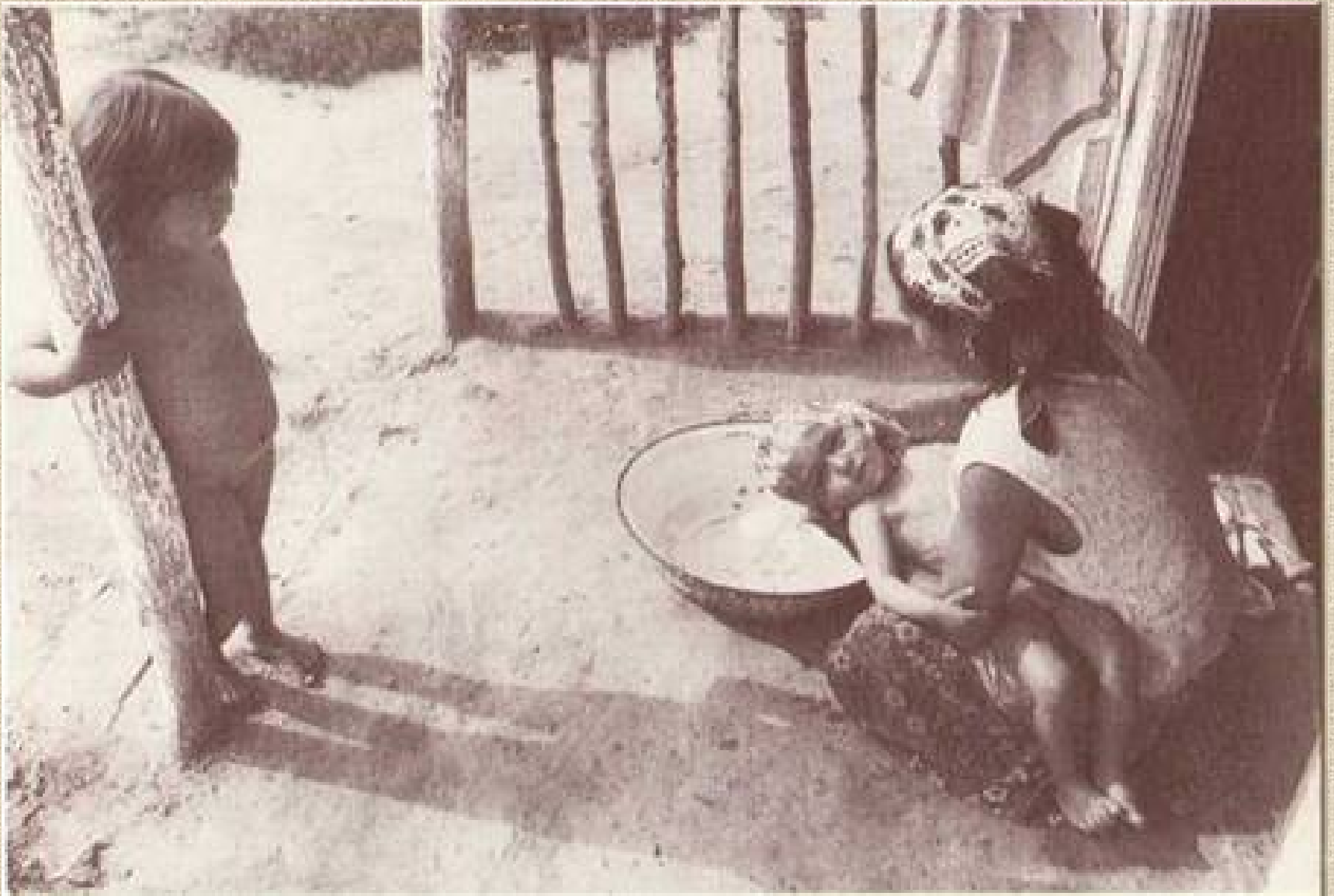
Gyermekek fürdetése – Alsószentmárton, 1975 (Révész Tamás)