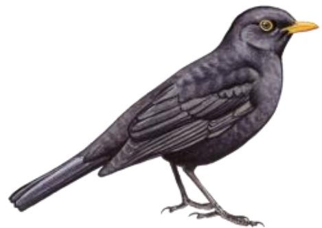
© Kókay Szabolcs - MME - www.mme.hu