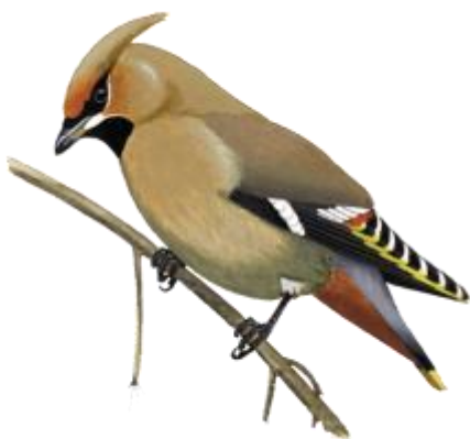
© Kókay Szabolcs - MME - www.mme.hu