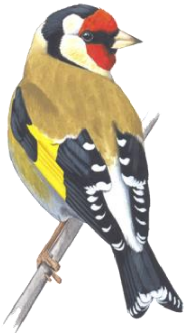
© Kókay Szabolcs - MME - www.mme.hu