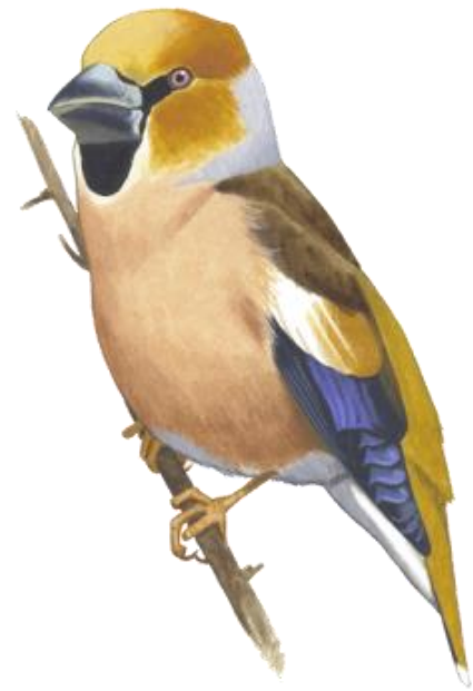
© Kókay Szabolcs - MME - www.mme.hu